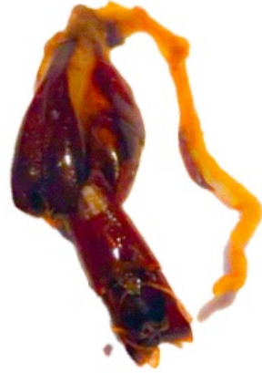
Fig. 5. Aparato copulador del mismo ejemplar.