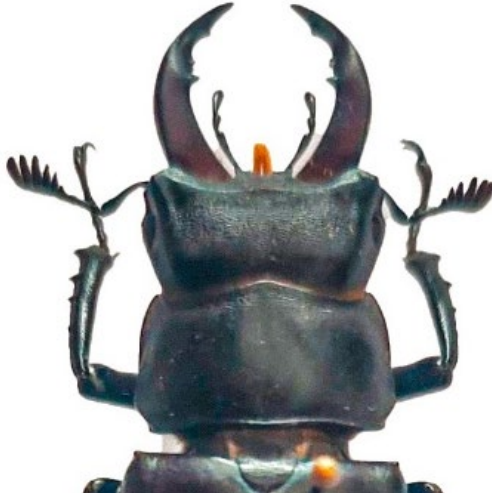
Fig. 4. Detalle de cabeza y tórax de Lucanus pontbrianti (Mulsant, 1839).